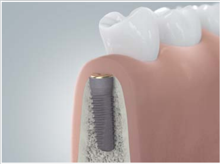
Einheilen des eingesetzten Implantats