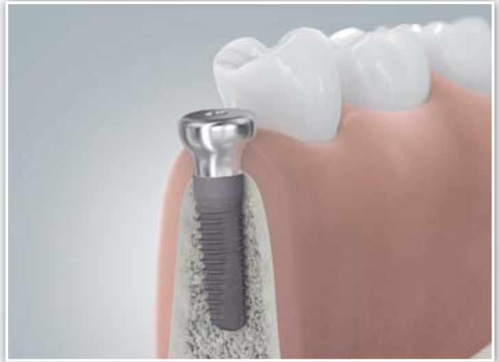
Ausformen des Zahnfleisches