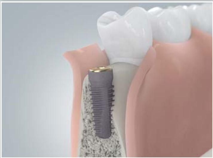
Knochendefizit am Implantat