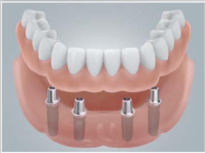
Befestigung mit Doppelkronen