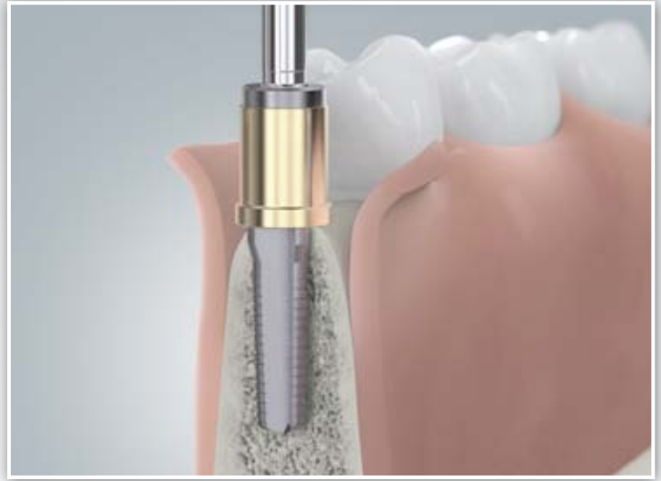
Bohrung mit Spezialbohrer