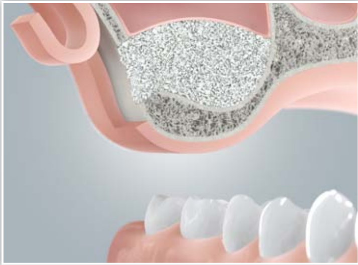
Knochenaufbau im Oberkiefer (Sinusbodenelevation)