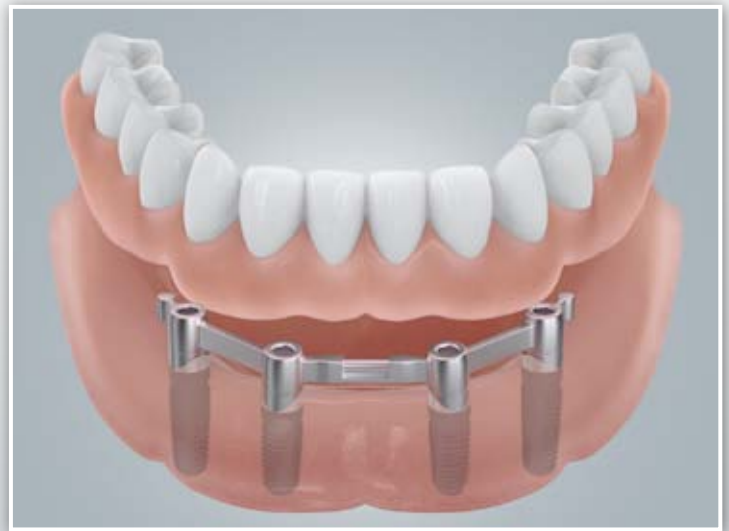
Befestigung mit einem Steg