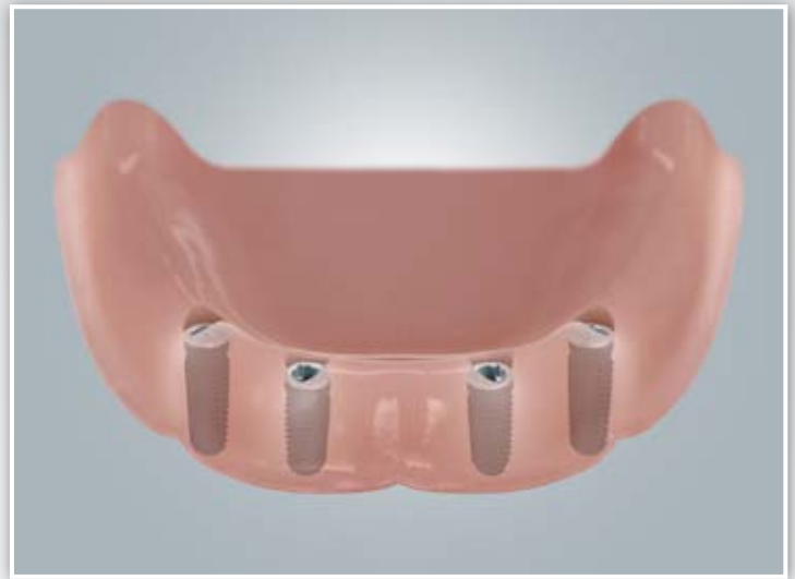
Zahnloser Unterkiefer mit vier Implantaten