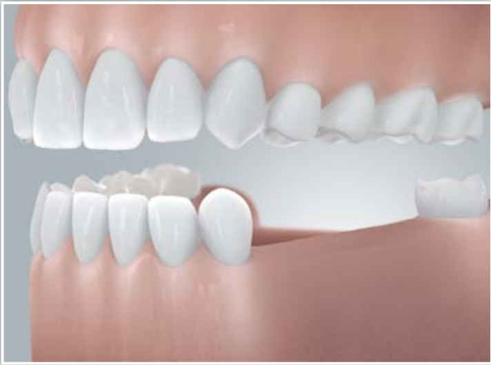
Schaltlücke (zahnbegrenzte Lücke)