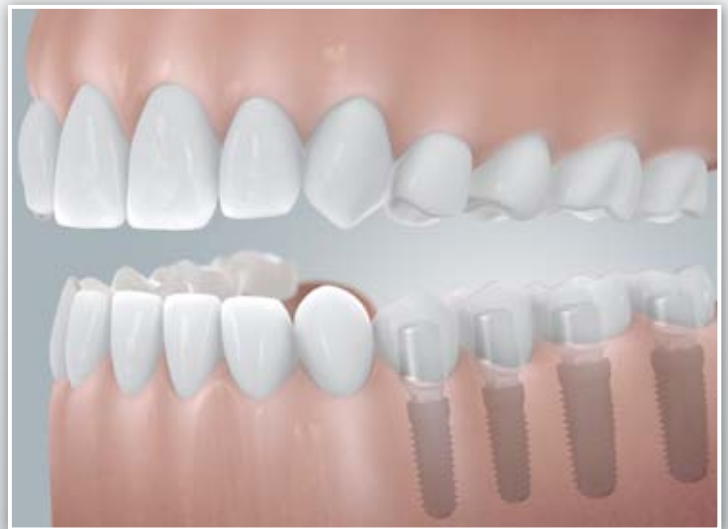
Einzelkronen auf mehreren Implantaten