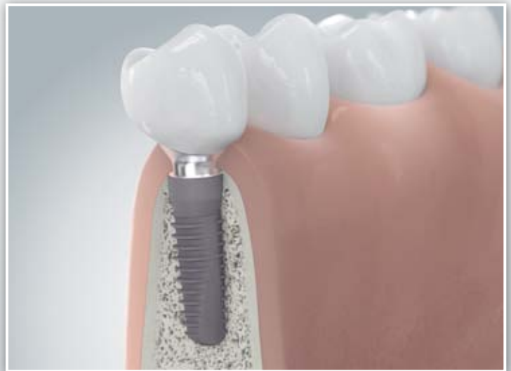
Zahnimplantat, Implantataufbau und Zahnkrone