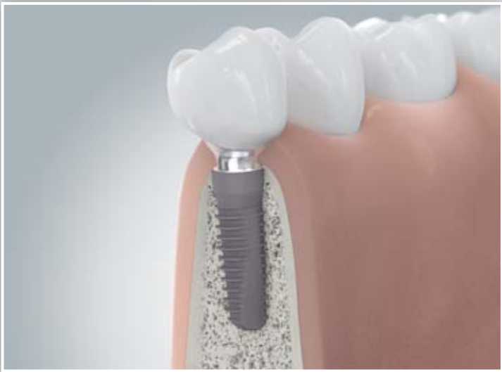
Implantatkrone nach Knochenaufbau