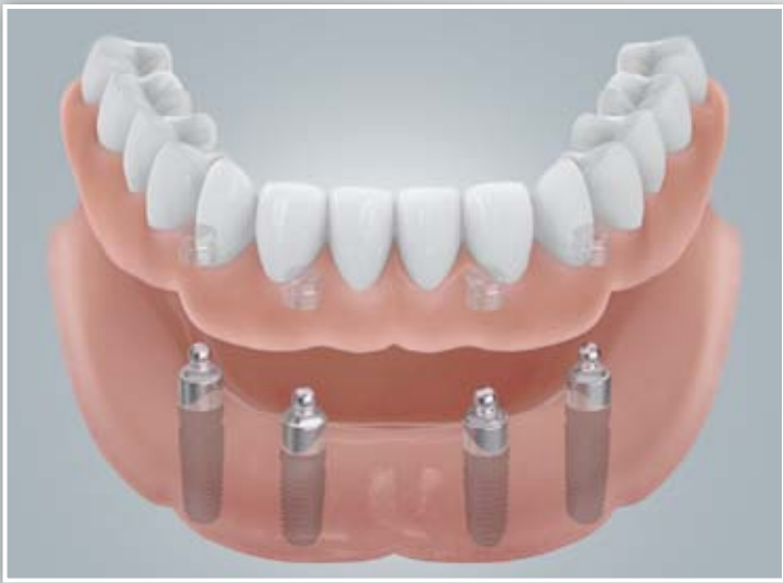
Befestigung mit Kugelankern