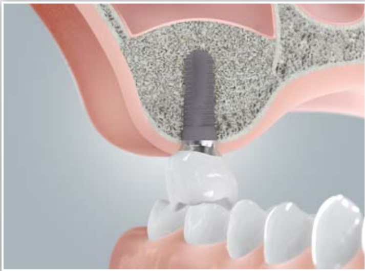
Implantatkrone nach Sinusbodenelevation